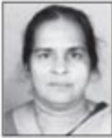
ലൂസിപോൾ തേയ്ക്കാനത്ത് പ്രസിഡണ്ട്