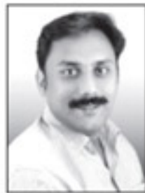
സെബി കളളാപറമ്പിൽ സെക്രട്ടറി