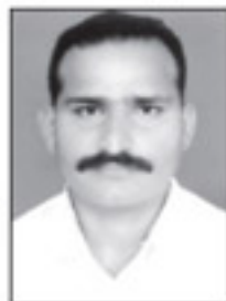
ജിജിമോൻ കുറുപ്പാപറമ്പിൽ ട്രഷറർ