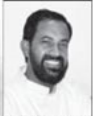
ഫാ. ജോൺസൺ തളിയത്ത്

യേശു അവരോടു പറഞ്ഞു. “എന്നെ അനുഗമിക്കുവിൻ. ഞാൻ നിങ്ങളെ മനുഷ്യരെ പിടിക്കുന്നവരാക്കാം”.