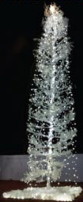
ടി.എസ്.എസ്. - എസ്.എസ്.എസ്.