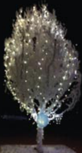
ടി.എസ്.എസ്. - എസ്.എസ്.എസ്.