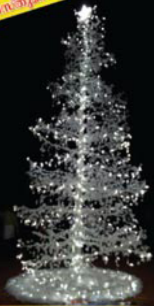
ടി.എസ്.എസ്. - എസ്.എസ്.എസ്.