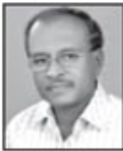
ജോർജ്ജ് എറാട്ടുകാൻ സെക്രട്ടറി