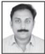
സെബി കള്ളാപറമ്പിൽ കൺവീനർ