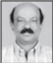
ജെയിംസ് നെല്ലിശ്ശേരി മ്യൂസിയം