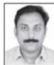
സെബി കള്ളാപറമ്പിൽ കൺവീനർ റിസപ്ഷൻ