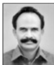
ഡേവിസ് കുറ്റിക്കാടൻ സെക്രട്ടറി