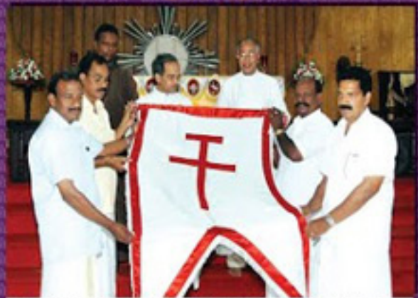
മുഖ്യമന്ത്രിയുടെ അദ്ധ്യക്ഷതയിൽ നടന്ന സെന്റർ ബാറ്റിംഗ് ഹാളിന്റെ ഉദ്ഘാടനം