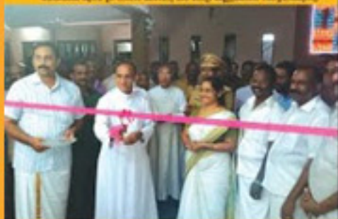
അടുത്തു് അമ്മിൾ് അ.എ. അൻ്റ് എസ്റ്റേബ്ലിഷ്മെൻ്റ് നിയോഗിയ്ക്കുന്നു