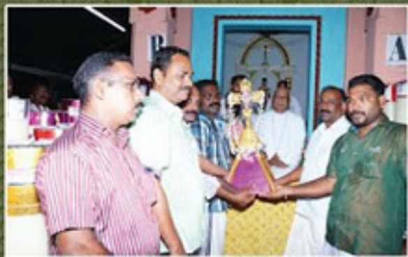
എടപ്പാതിലേക്ക് തിരുനെൽവേലിയിൽ നിന്ന് എഴുന്നേൽക്കുന്നു