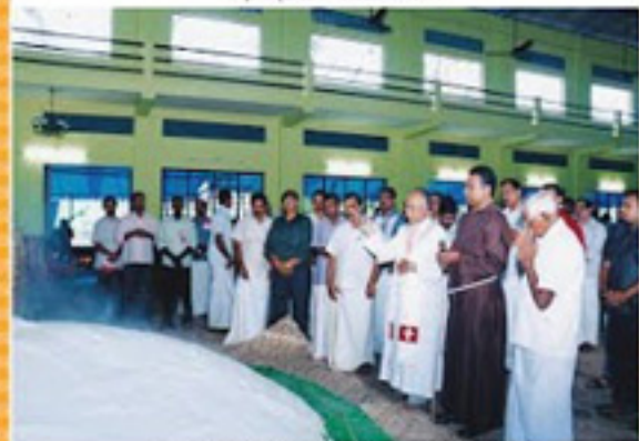
അടുത്തു് അമ്മിൾ് അ.എ. അൻ്റ് എസ്റ്റേബ്ലിഷ്മെൻ്റ് നിയോഗിയ്ക്കുന്നു