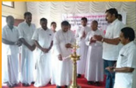
അമ്മിൾ് എൻ്റ് പാരിഷ് അ.എ. അൻ്റ് എസ്റ്റേബ്ലിഷ്മെൻ്റ് നിയോഗിയ്ക്കുന്നു