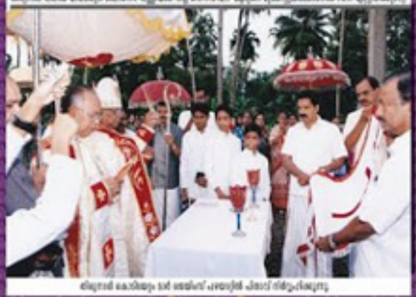
മുഖ്യമന്ത്രിയുടെ അദ്ധ്യക്ഷതയിൽ നടന്ന സെന്റർ ബാറ്റിംഗ് ഹാളിന്റെ ഉദ്ഘാടനം