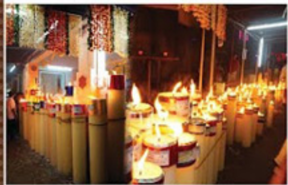
Այնպեսով զրոյան զոտով անձանկ զոտով զոտով