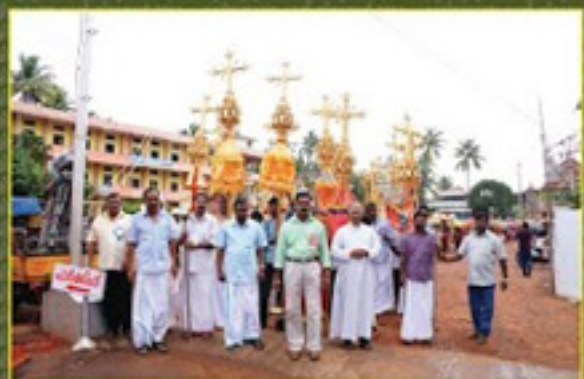
മുട്ടൂർ പ്രാർത്ഥനയിൽ മുട്ടൂർവേലിയിൽ നിന്ന് എഴുന്നേൽക്കുന്നു