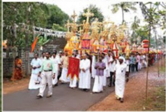
മുട്ടൂർ പ്രാർത്ഥനയിൽ മുട്ടൂർവേലിയിൽ നിന്ന് എഴുന്നേൽക്കുന്നു