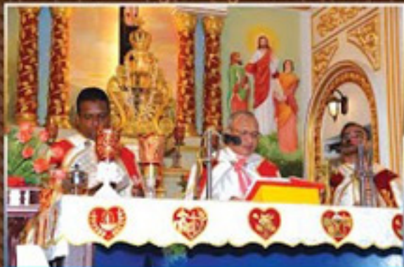
Այսպեսով, զրո քրոջը՝ զրո անձանկ - զոտ, անտրոջ զրոյան