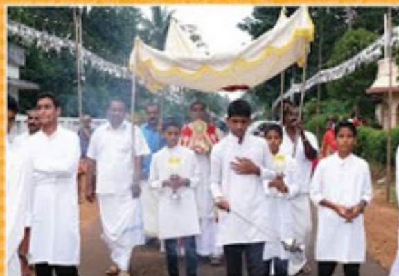
മിസ്സൽ പാരിഷ് അദ്ധ്യക്ഷനാണ്