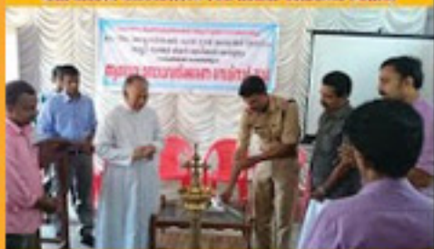
അമ്മിൾ് പാരിഷ് അ.എ. അൻ്റ് എസ്റ്റേബ്ലിഷ്മെൻ്റ് നിയോഗിയ്ക്കുന്നു