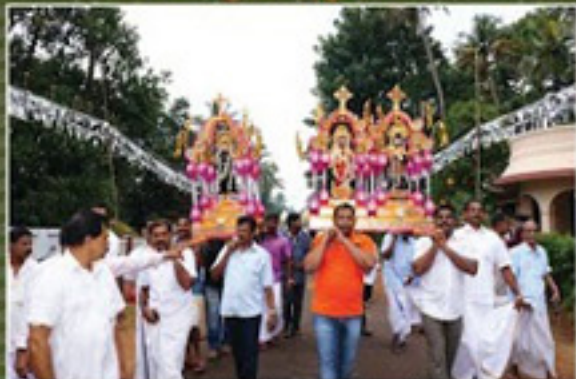
മുട്ടൂർ പ്രാർത്ഥനയിൽ മുട്ടൂർവേലിയിൽ നിന്ന് എഴുന്നേൽക്കുന്നു